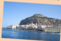
jusqu'à la Sicile...