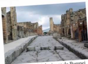
Les vestiges archéologiques de Pompei