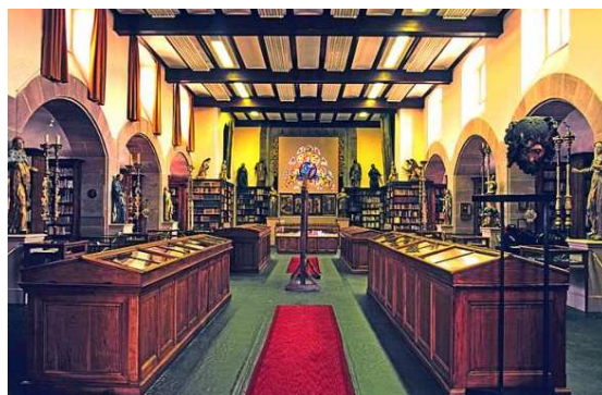
Sélestat Bibliothèque humaniste