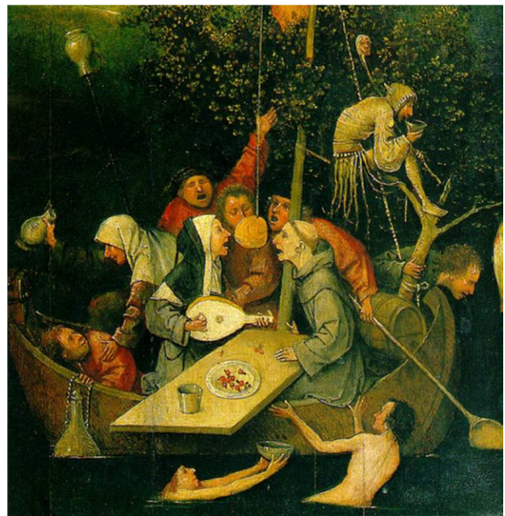
Hieronymus Bosch: Das Narrenschiff (Musée du Louvre, um 1500)