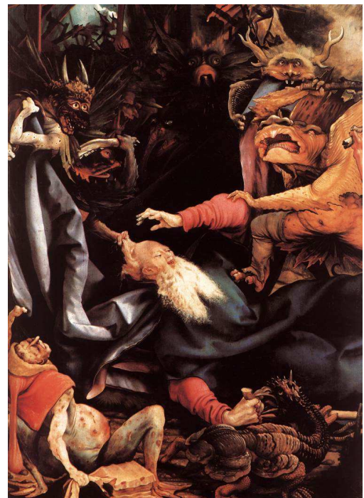
Matthias Grünewald: Die Versuchung des heiligen Antonius