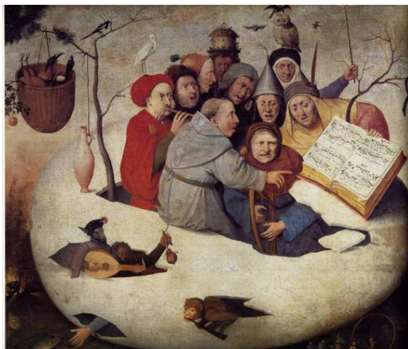
Hieronymus Bosch: Der Garten der Lüste (Ausschnitt)