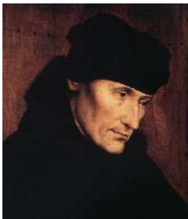
Erasmus von Rotterdam

• In einer Zeit der Fragen besinnen wir uns auf Vorbilder, Denker unserer Region am Oberrhein, die die Frage nach dem Menschlichen bereits um 1500 stellten. Dazu gehören Erasmus von Rotterdam, Sebastian Brant und andere Gelehrte der humanistischen Zentren wie z.B. die Humanisten um Beatus Rhenanus, Johann Geyley von Kaysersberg und Jacob Wimpfeling in Sélestat.